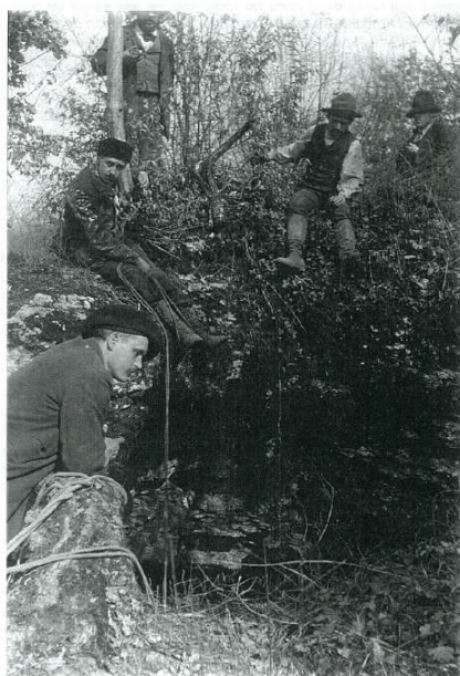
Puits de Chinchin - 10 mars 1901

Commune de Vaire-Arcier Samedi 20 septembre 2014